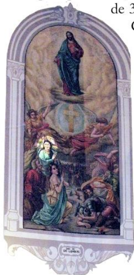
Tableau "La gloire du Christ"